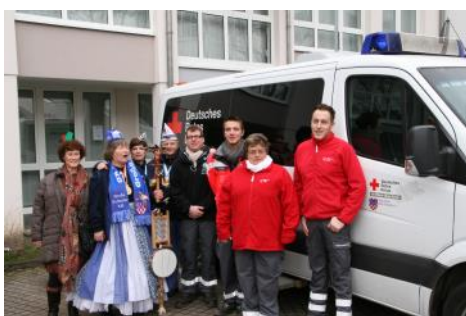
Klare Aufteilung - Feiern und Dienst im Wechsel