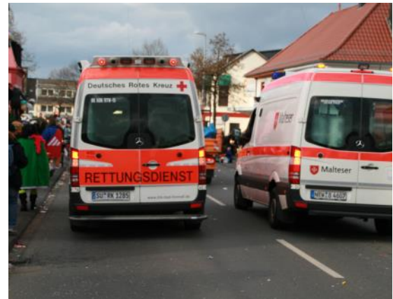
Sicherheit bei den Veranstaltungen - DRK Rettungsdienst

Die Einsatzzahlen des Rettungsdienstes sind auch in diesem Jahr wieder angestiegen. Bereits vor eineinhalb Jahren führten die steigenden Einsatzzahlen dazu, dass die ehrenamtliche Organisation des Rettungsdienstes in Bad Honnef in hauptamtliche Hände übergegangen war. Eine erfolgreiche Zusammenarbeit erfolgt seitdem zwischen dem Ortsverein und der DRK Rettungsdienst gGmbH des Kreisverbandes. Die tägliche Organisation, die Besetzung der Einsatzfahrzeuge im Regeldienst erfolgt nun in Verantwortung der DRK Rettungsdienst gGmbH. Der Ortsverein stellt weiterhin seine Fahrzeuge, die Rettungswache und die Besetzung der Fahrzeuge bei sog. rettungsdienstlichen Sonderlagen oder den Sanitätswachdiensten sicher.