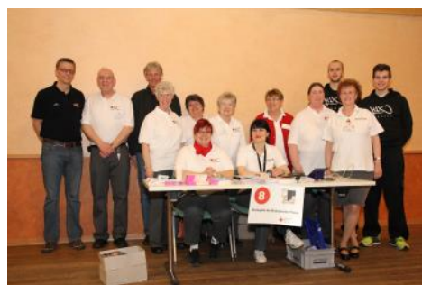
Blutspendeteam mit Basketballern aus Rhöndorf