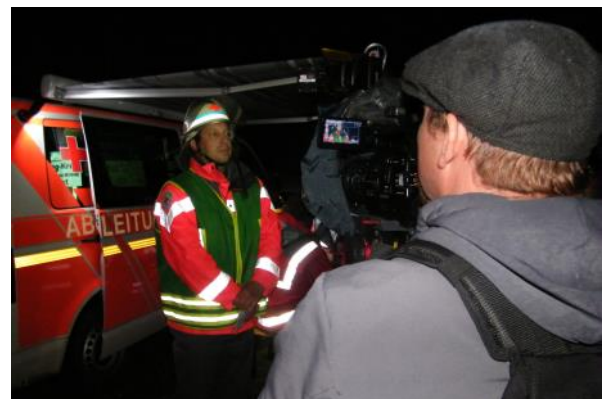
Fortbildung für Führungskräfte des Ortsverein - Presse- u. Kameratraining