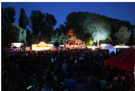
Insselfeste, ein Zuschauermagnet