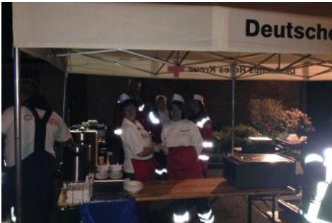
Verpflegung von Einsatzkräften - eine besondere Herausforderung