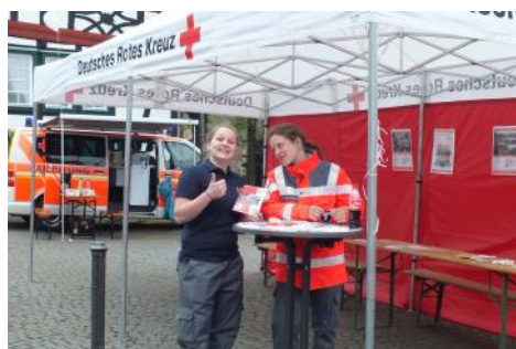
Immer ein Lächeln bei der Arbeit - DRK in Aktion