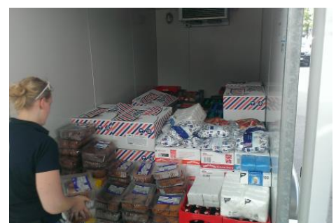
Düsseldorf - Verpflegung von 450 Einsatzkräften