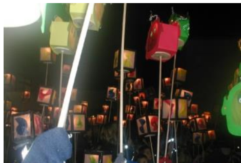
Martinszüge—jedes Jahr eine nette Abwechslung