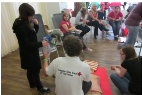
Reanimationstraining in Arztpraxen