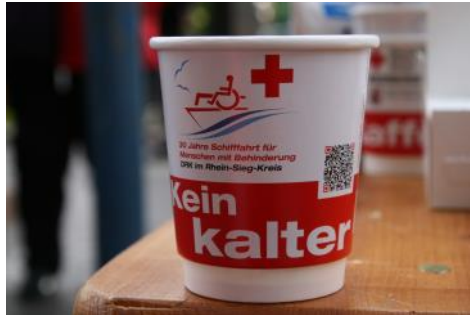
Mai 2014- „Kein kalter Kaffee, wir geben einen aus“