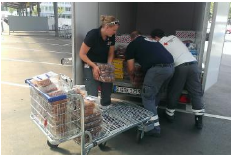
Selbstverständlich kann auch ein „Nachkauf“ vor Ort erfolgen