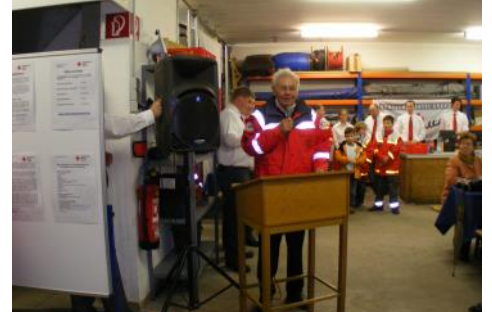
Festakt .- Einweihung des Siegfried-Westhoven-Hauses