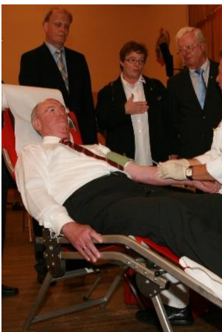
Besuch von Dr. Rudolf Seiters bei der Blutspende