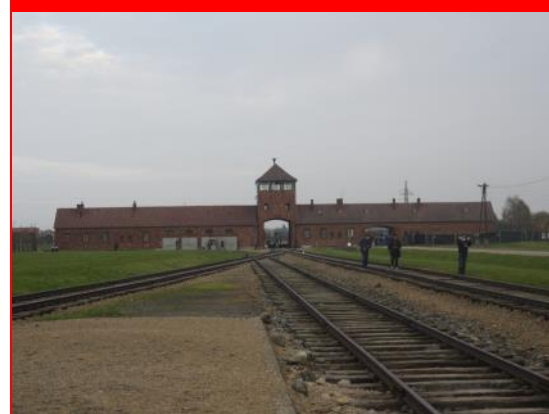
Auschwitz - Geschichte hautnah erleben