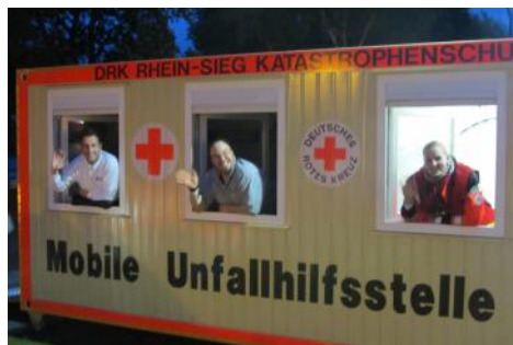
„Spaß“ kommt auch bei uns nie zu kurz !!