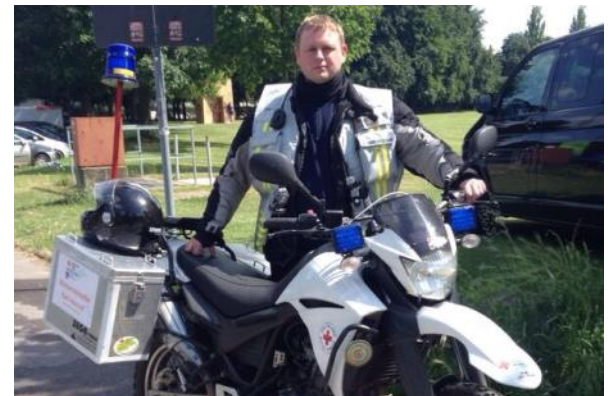
„Kradstaffel“ international unterwegs - Fahrradtour Bonn > Eupen (B)