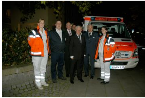
Besuch des DRK Bundespräsidenten Dr. Rudolf Seiters