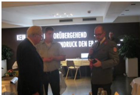
Eine Zusammenarbeit alle Organisationen war ihm wichtig