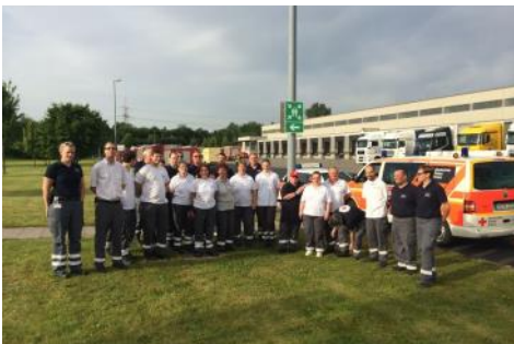
Essen u. Düsseldorf - fast 1000 Einsatzkräfte versorgt