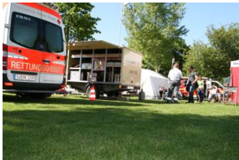
Insel Grafenwerth - Schöne Feste, aber auch viel Arbeit