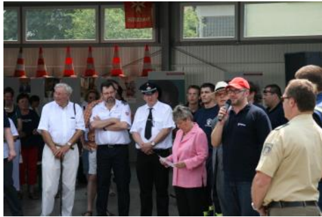
Immer mitten drin; als Teil seiner DRK Gemeinschaft