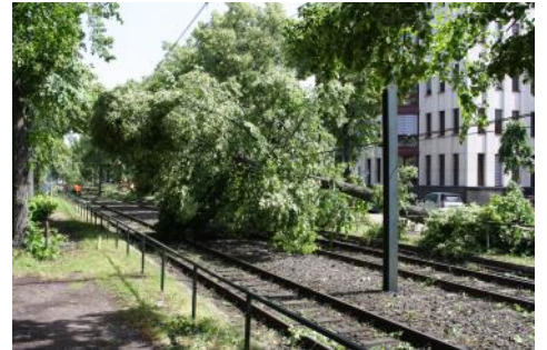
Die Ursache für die Einsätze in Düsseldorf u. Essen