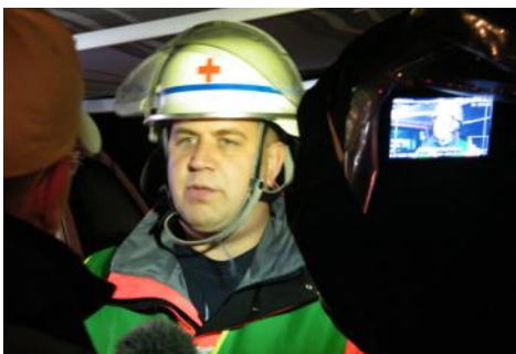
Kameratraining für unsere Pressesprecher