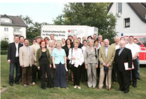
Wichtige Projekte wurden von ihm realisiert