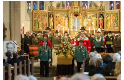
Für immer in unseren Herzen.....