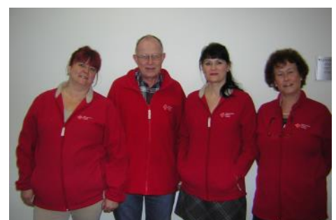
Presseaktion eines Arbeitgebers - Blutspende