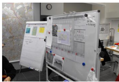
Aus- und Fortbildung für Führungskräfte