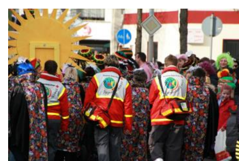
Jugendrotkreuz—Mitten drin, statt nur dabei