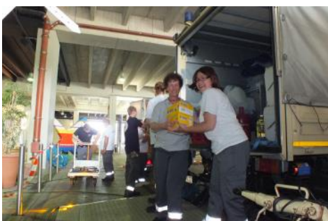
Trotz Alarmierung um 05:45 Uhr—Spaß muss sein