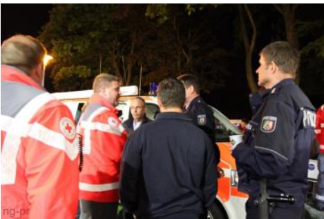
Lagebesprechungen mit Polizei und Ordnungsamt