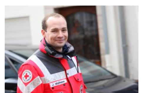
Pressesprecher auch im Sanitätsdienst tätig