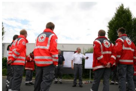
Helfertage... Eine willkommene Abwechslung