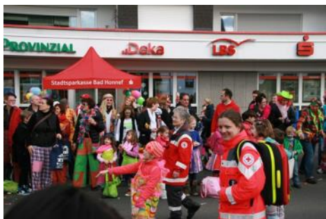
Karneval: Wenn Sie feiern, passen wir auf Sie auf !!!