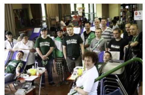
Fanclub des HFV zu Gast bei der Blutspende...