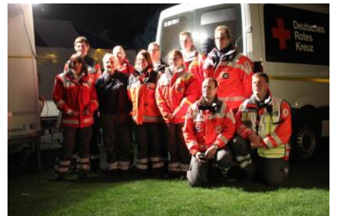
Besuch der „Presse“ bei Rhein in Flammen - Danke !!!