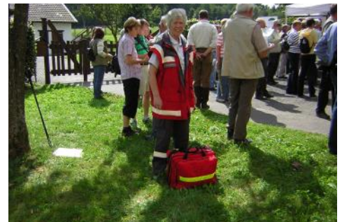
Wanderungen im Siebengebirge.....