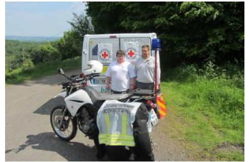
Volkswandern - Alle 7 Berge an einem Tag