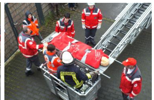
Patientenrettung mit der Drehleiter