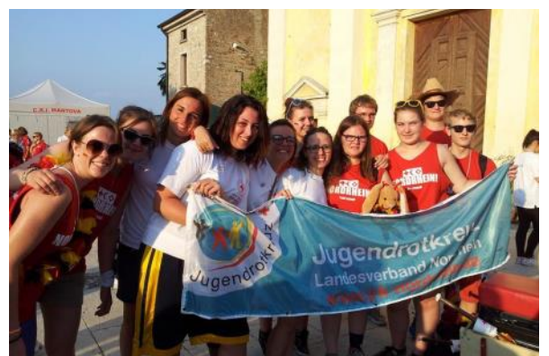
Honnefer JRK'ler in Solferino - eine Reise die man nie vergessen wird