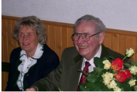
Ein Leben für die Vereine in Bad Honnef