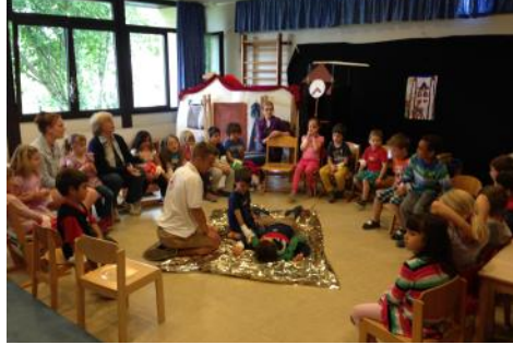
Erste Hilfe Schulung im Kindergarten - früh übt sich.