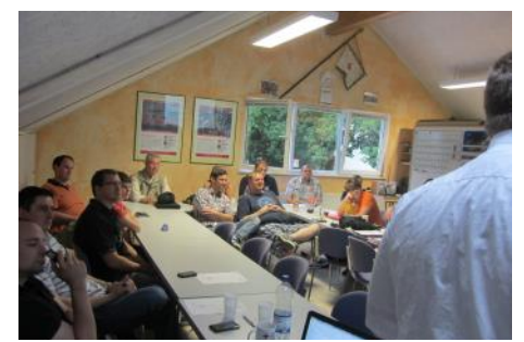
Regelmäßige Fortbildung wird groß geschrieben