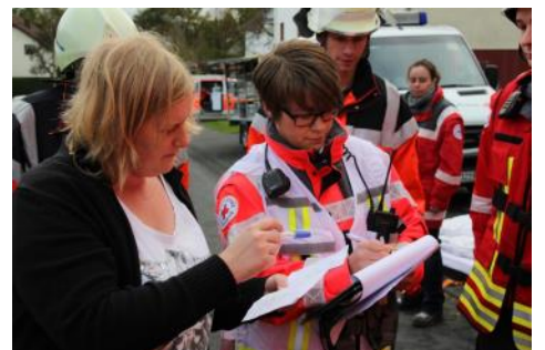
Frauen in der Führungsriege? Bei uns selbstverständlich!