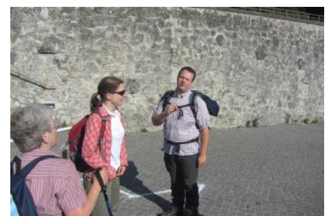
Volkswandern - nicht nur ein Sanitätsdienst