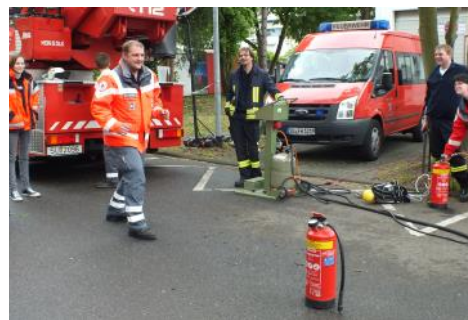
Fortbildung mit der Feuerwehr - löschen aber wie!