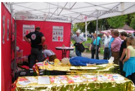
Öffentlichkeitsarbeit - ein wichtiges Thema