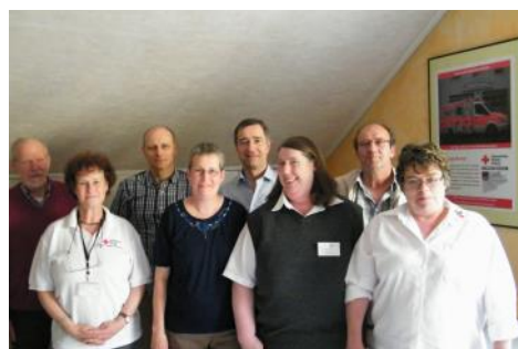
Blutspenderehrung in kleiner Feierstunde