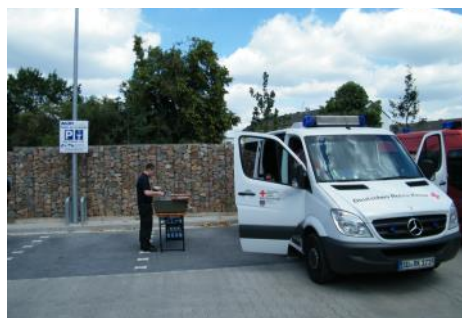
Versorgung der Rhein-Sieg Einsatzkräfte in Essen