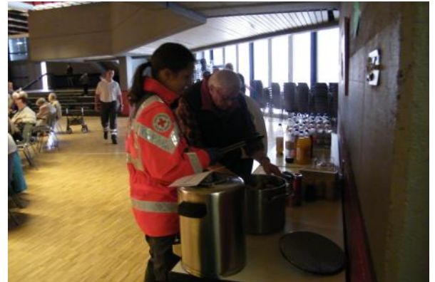
Versorgung der Bevölkerung in Unglücksfällen - Honnefer Verpflegungsdienst

Inhaltlich Verantwortlicher gemäß § 6 MDStV: Jens Koelzer Vorsitzender: Uwe Westhoven VR: 307 - Amtsgericht Königswinter Layout, Texte und Realisierung: Brigitte u. Jakob Waßmann, Jens Koelzer