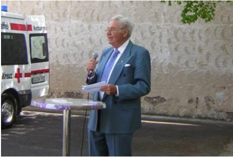
2007—Tag der offenen Tür, Rettungswache