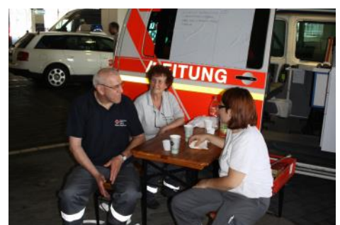
Kurze Verschnaufpausen sind wichtig !