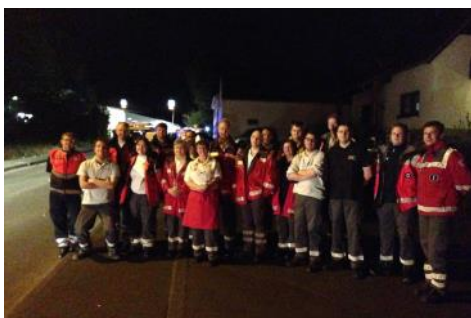
Betreuung der Feuerwehr in Stieldorf