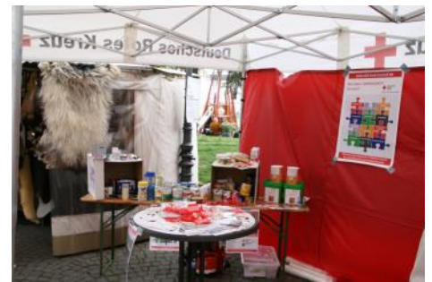
Präsentation beim Stadtfest