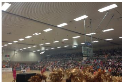
Spitzensport in Bad Honnef, das DRK mitten drin