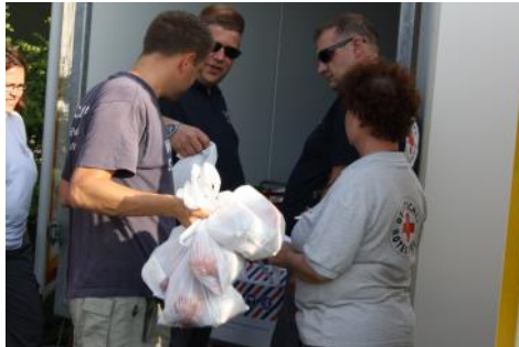
Neben Warmverpflegung - 900 Lunchpakete