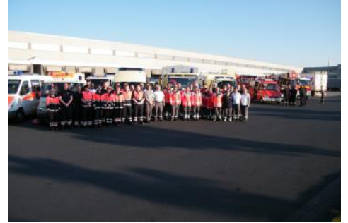
Essen - Viel unterwegs waren die Helfer in diesem Jahr