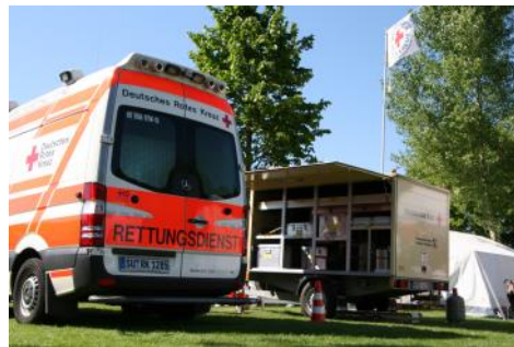
Rhein in Flammen - Sonne pur