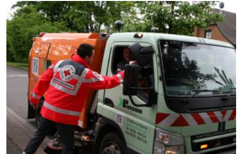
Viele kamen vorbei und freuten sich über einen heißen Kaffee