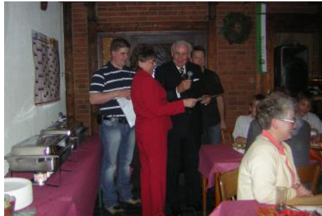
Weihnachtsfeiern - ein Dankeschön für die Aktiven