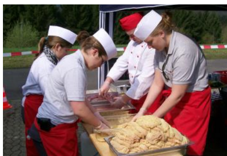
Auch frische Zubereitung ist für uns kein Problem!