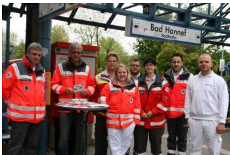
Aktion „Kein kalter Kaffee - wir geben einen aus“