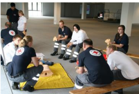
Helfertag: Unsere Ausbilder im Rhein-Sieg-Kreis unterwegs