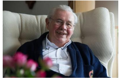
Seine Tür stand immer offen - Sein Rat war immer gefragt