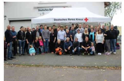
Besuch von Freunden - Rhöndorfer Basketballer