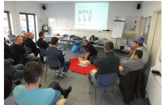
Erste Hilfe Ausbildung: Gemeinsam mit den hauptamtlichen Ausbildern des Kreisverbandes bilden unsere ehrenamtlichen Ausbilder die Bevölkerung und Firmen aus

Bei der Bereitschaftsfahrt wurden interne Schulungen im Bereich der Fahrzeugkunde, der Hygiene und der Verpflegungsausgabe theoretisch besprochen und das Fahren in Kolonne praktisch geübt.