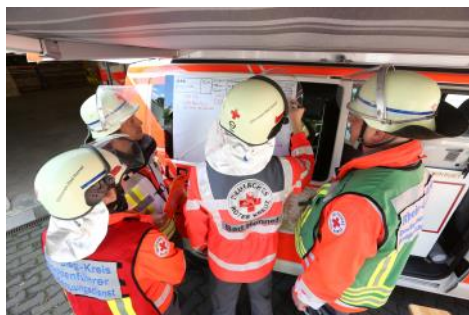
Planung ist alles - DRK Helfer am ELW