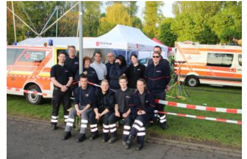
Gemeinsam im Einsatz - DRK und MHD Bad Honnef