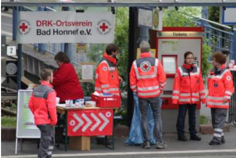
Präsentation der Rot Arbeit in Bad Honnef