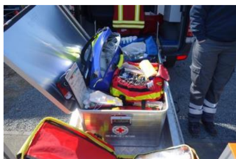
Ausstattung des Ortsvereins für den Notfall