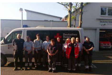
Gruppenbild vor einem Sanitätswachdienst