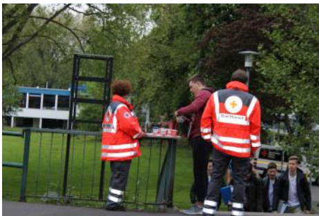
Aktion „Kein kalter Kaffee“ auch 2017 ein Erfolg