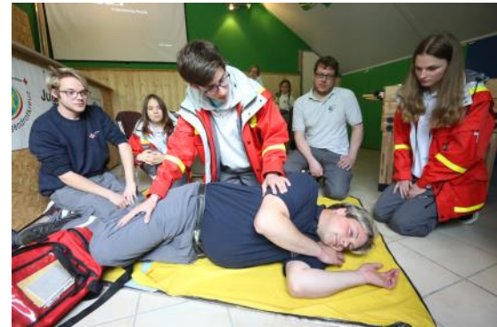
Erste Hilfe - ein wichtiger Bestandteil in der Jugendarbeit