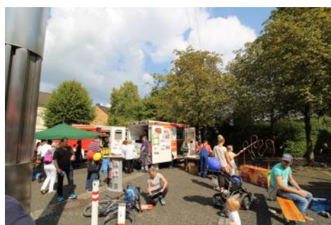
Präsentationsarbeit in Oberpleis