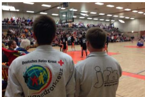
Spitzensport - für DRK u. JRK ein Highlight