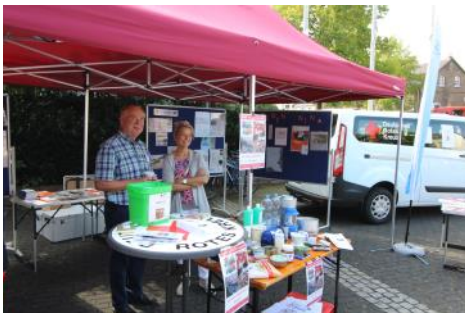
Hilfe zur Selbsthilfe—Präsentation in Oberpleis