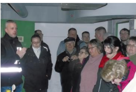
Besuch eines Schutzbunkers in Hamburg