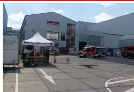
Versorgung der Feuerwehr Bad Honnef