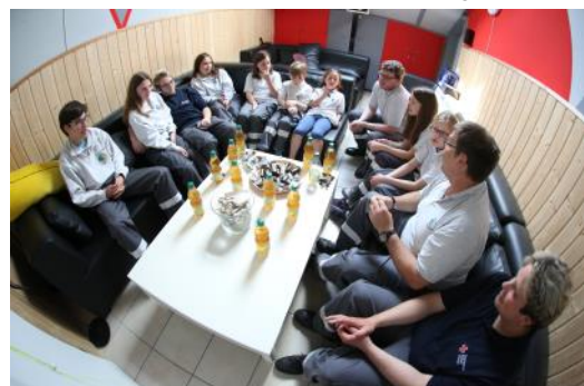
Nicht nur dienstlich eine starke Gemeinschaft