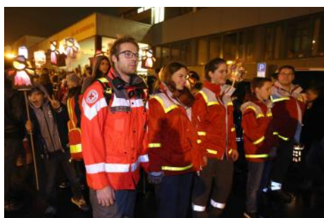
Feste in Bad Honnef - DRK u. JRK sind dabei