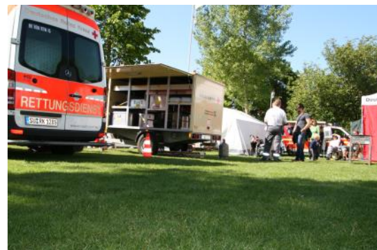
Oben: „Kein kalter Kaffee“ Unten: Versorgung Inselstufe

Deutsches Rotes Kreuz Ortsverein Bad Honnef e. V. Servicestelle Ortsverein Austr. 29 53604 Bad Honnef Tel 02224 931393 Email: servicestelle@drk-bad-honnef.de