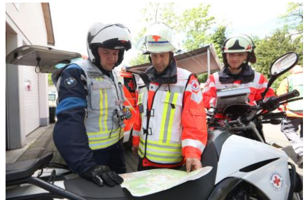
Das Krad ist im täglichen Dienst nicht mehr wegzudenken