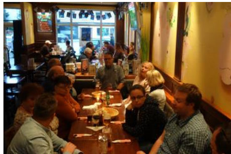
Gesellig am Abend in Hamburg