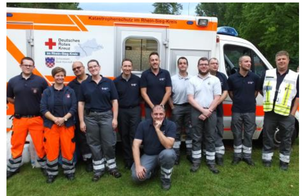
Haupt- und Ehrenamt - im Siebengebirge läuft es gemeinsam