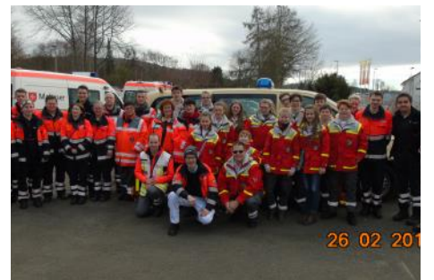
Karneval 2017 in Bad Honnef