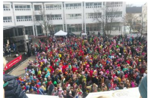
Karneval in Bad Honnef, das DRK mitten drin