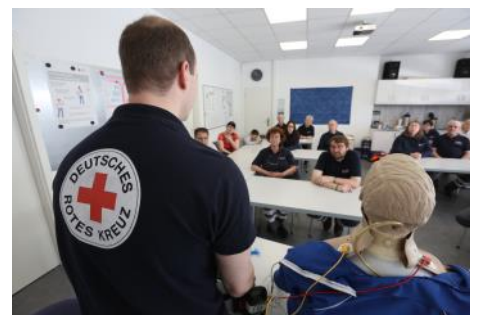
Bereitschaftsabende in Bad Honnef