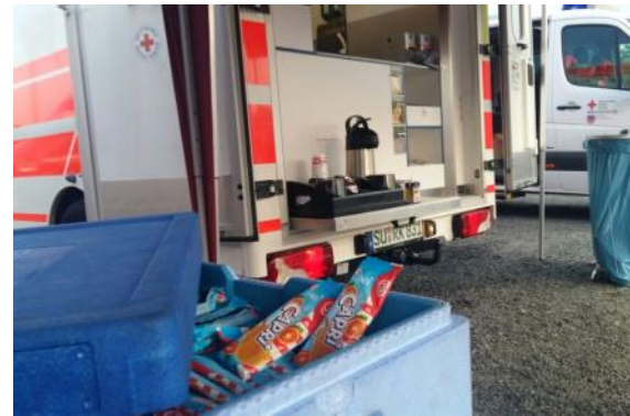
Verpflegungseinsatz in Hennef - Eis zur Abkühlung bei hohen Temperaturen

Am 20.05. erfolgte die Auslieferung des GW Versorgung. Fünf Tage später konnte das Fahrzeug offiziell in den Dienst gestellt werden. Bereits vier Tage danach erfolgte die erste Alarmierung für das Versorgungsgespann nach Hennef. Im Rahmen eines Großeinsatzes der Feuerwehren wurden vordringlich Kaltgetränke und im weiteren Verlauf Würstchen und Schnitzel für die Kräfte im Bereitstellungsraum angefordert. Nach über fünf Stunden Dauereinsatz konnten die Helfer erschöpft aber zufrieden die Einsatzstelle verlassen. Nach dem ersten Einsatz hatte sich das neue Einsatzfahrzeug bis auf ein paar Kleinigkeiten als vollkommen durchdachtes Konzept herausgestellt.