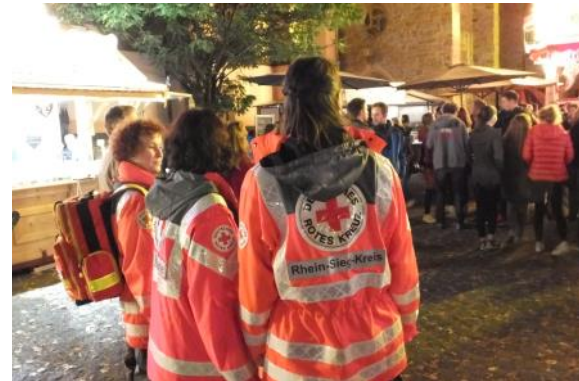
Für Sie im Einsatz: ob beim Martinimarkt oder zu Karneval