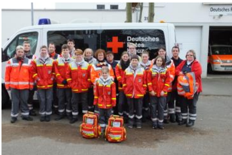
Volkswandern, Einsatz für Groß und Klein