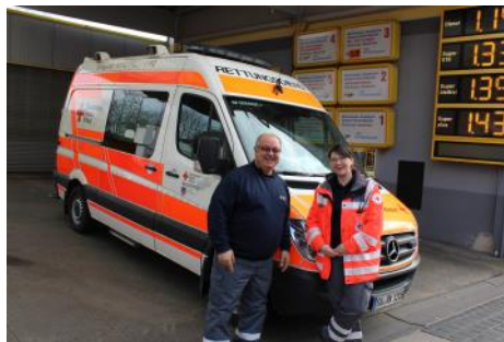
Bereitstellung Karneval in Bad Honnef