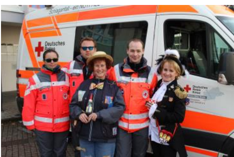
Wenn andere feiern sorgen wir für die Sicherheit