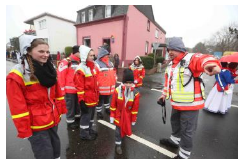
Bei Wind und Wetter für Sie im Einsatz