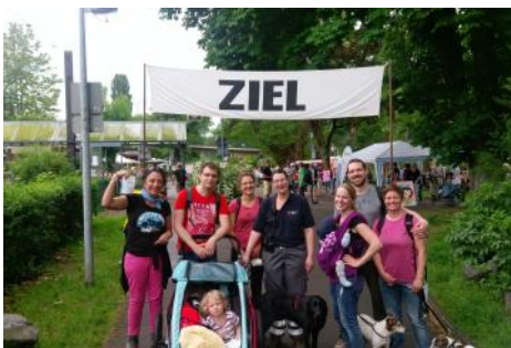
Rettungsdienst u. DRK gemeinsam bei Volkswandern