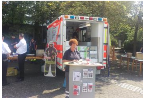
Präsentation „Hilfe zur Selbsthilfe“ in Oberpleis