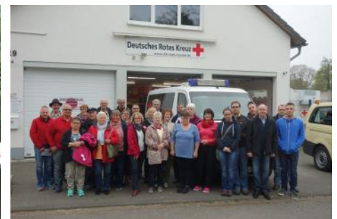
Vor der Abfahrt nach Hamburg