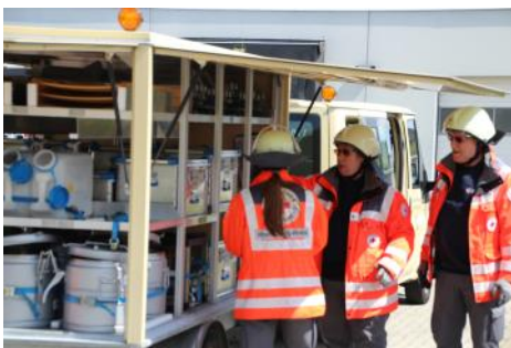
Ausbildung am Helfertag in Rheinbach