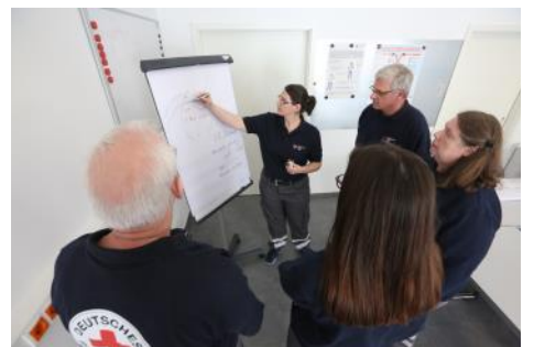
Aus- u. Fortbildungen ein Muss im DRK