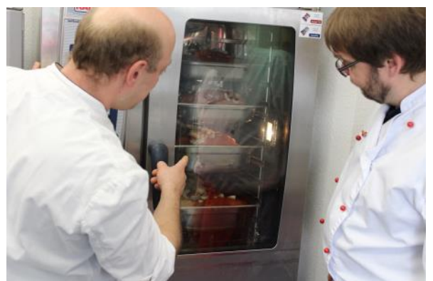
Kochen für Einsätze, Lehrgänge und sonstige Veranstaltungen