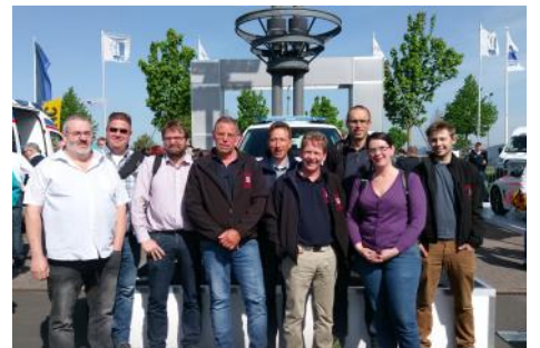
Gemeinsam auf Reisen - FW, DRK und Rettung