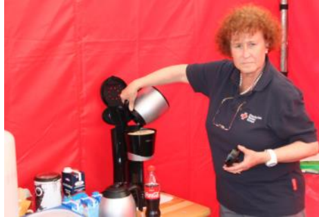
Eigenversorgung im Sanitätsdienst ein Muss