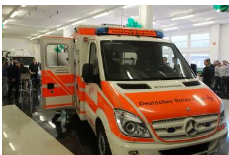
Catering beim Fahrzeughersteller Miesen, Bonn