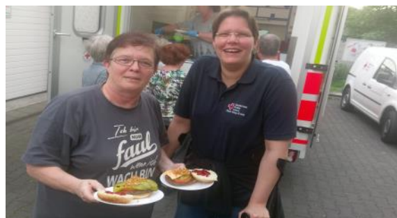
Kreis-Blutspende-Stammtisch in Bad Honnef