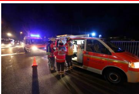
Honnefer Führungskräfte im Rhein-Sieg-Kreis tätig