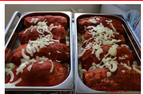
Veranstaltungsverpflegung mal anders.....