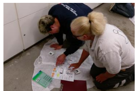
DPS - Fortbildungen für den „großen“ Notfall