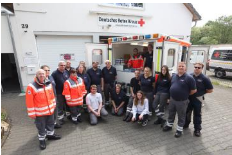
Ein neues Fahrzeug für das DRK Bad Honnef