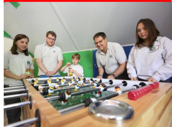
Sport, Spiel und Freizeitaktivitäten stehen im Vordergrund