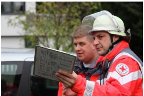
Honnefer Führungskräfte im Einsatz