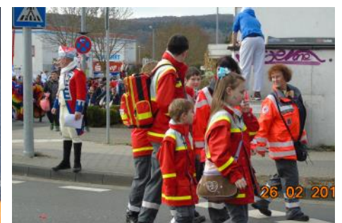
JRK und DRK gemeinsam im Einsatz