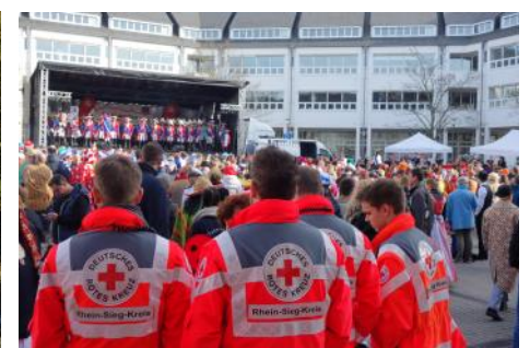
Mitten drin, statt nur dabei