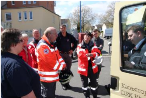
Grundlage für die Hilfe am Menschen - Fortbildung