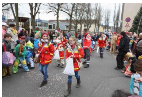
Jugend im Einsatz an Karneval