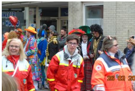
Jugend und Bereitschaft gemeinsam unterwegs