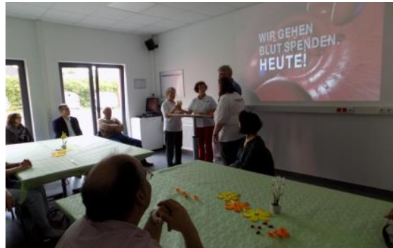
Blutspende Ehrung in Bad Honnef