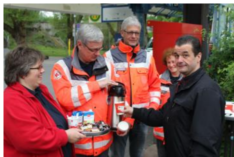
Aktion „Kein Kalter Kaffee“