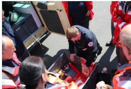
Gemeinsame Schulungen beim Helfertag