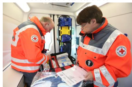
Wichtig vor jedem Dienstbeginn: Material auf Vollständigkeit checken