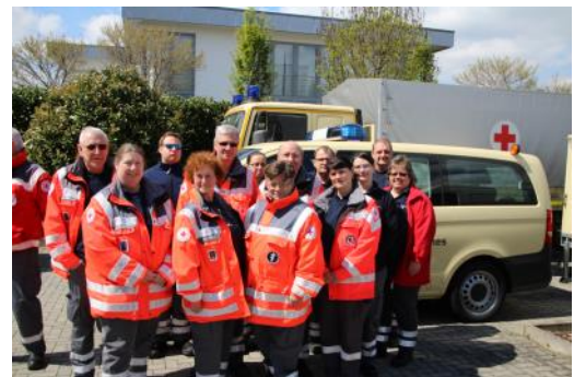
Fortbildung in der Gemeinschaft - hier Helfertag 2017

JETZT MITGLIED WERDEN WWW.DRK.DE/ JETZT-MITGLIED- WERDEN