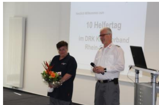
Feiern und Lernen - klar beim DRK ist alles möglich