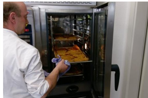
Spontanverpflegung im Einsatz - frische Schnitzel mit Brötchen -

Deutsches Rotes Kreuz Ortsverein Bad Honnef e. V. Siegfried Westhoven Haus Austraße 29 53604 Bad Honnef