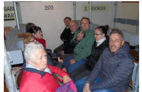
Besuch des Tiefenbunkers in Hamburg