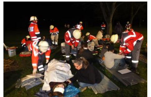
Für den Ernstfall üben...