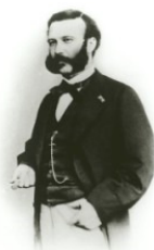
Henry Dunant Gründungsvater des DRK