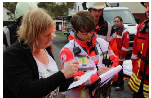
Lageabgleich zwischen Heim- u. DRK Leitung