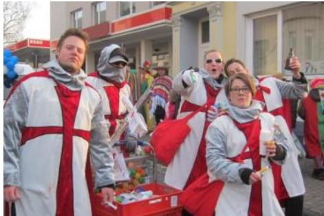
Spaß beim DRK—ja klar, feiern können wir auch...