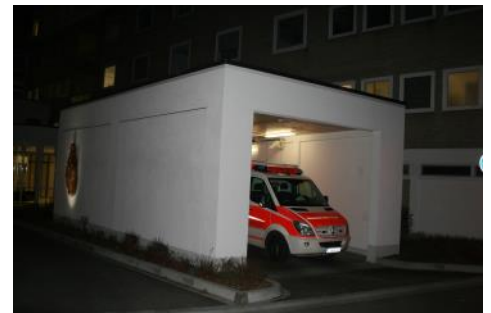
Zu jeder Tages- u. Nachtzeit im Einsatz