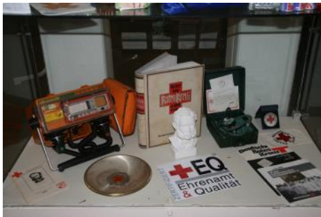
Ausstellung im Rathaus „150 Jahre Rotes Kreuz“