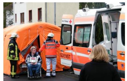
Übung Rettungsdienst u. Feuerwehr