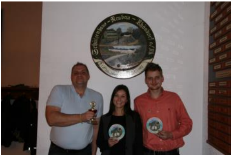
Die Gewinner des Weihnachtsschießen... Glückwunsch