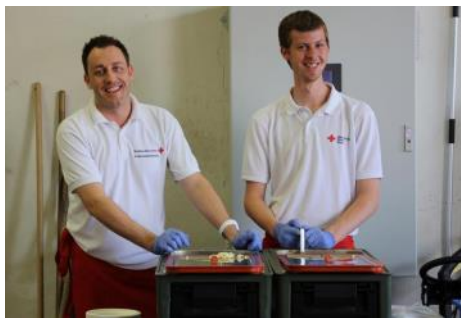
Verpflegungsausgabe beim Unwetter