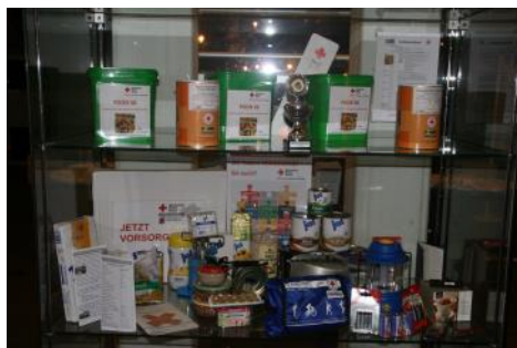
„Notfallvorsorge“ ein Zentrales Thema