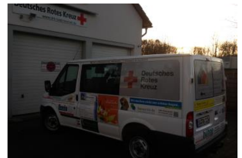
Ein neuer Mannschaftswagen im Fuhrpark