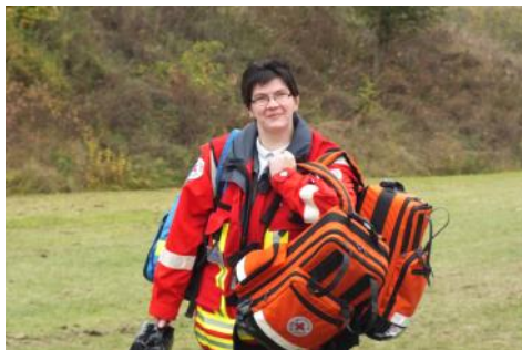
Wette verloren? Oder warum muss ich alleine aufräumen..