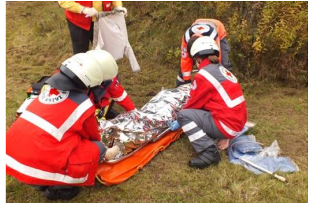
Wichtig für jeden Helfer, regelmäßige Fortbildungen