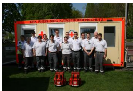
Rhein in Flammen am Nachmittag mit JRK