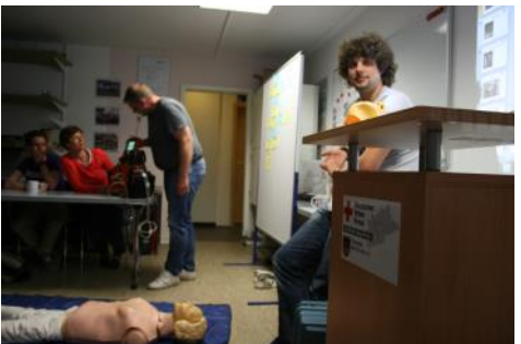
Erste Hilfe Workshop