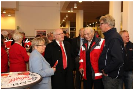
Aufstellungseröffnung im Rathaus Bad Honnef