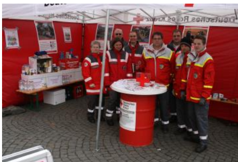
Präsentation bei „Fühl dich Frühlich“