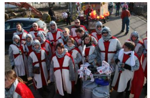
König Siegfrieds tapfere Ritter