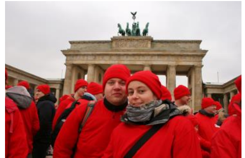
Mitten drin ... Menschenkreuz vor dem Brandenburgertor