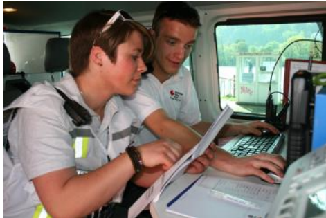
Frauen in der Führungsriege? Bei uns Selbstverständlich!