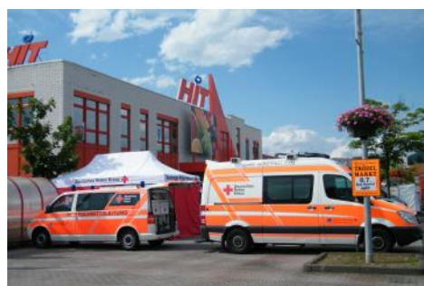
„Brings“ in Bad Honnef—DRK Kräfte mittendrin