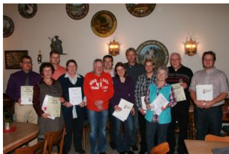
Helferehrungen beim Jahresabschluss