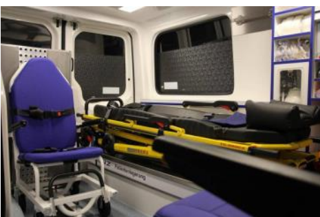
Moderne Techniken versprechen hohen Komfort