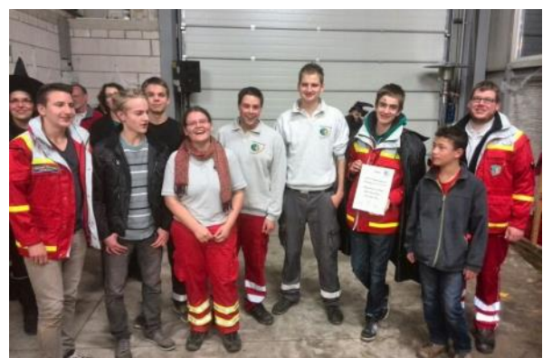
Teilnehmer der JRK Nachtwanderung in Wachtberg