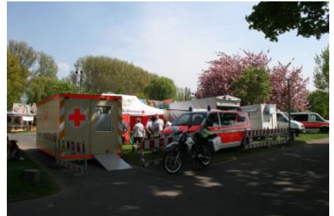
Sanitäts- u. Rettungsdienst bei Rhein in Flammen