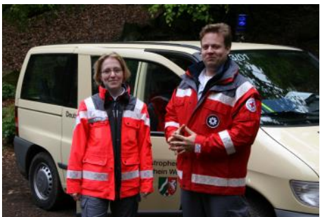
Die freundlichen Helfer bei Volkswandern