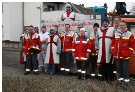
Feiern und Sicherheit—Kinderzug in Selhof