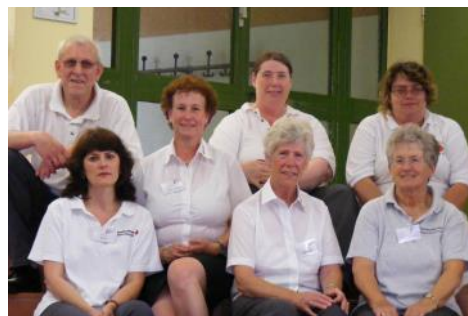
Gruppenfoto des Blutspendeteams