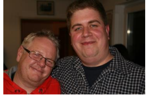
Ein Herz und eine Seele? Kassierer und Verwaltungsleiter