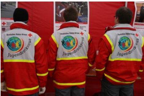
Mitten drin, statt nur dabei... Unser Jugendrotkreuz