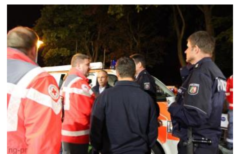
Lageabgleich: DRK, Polizei und Ordnungsamt