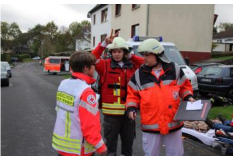
Übungen, ein wichtiger Bestandteil der Einsatzkräfte