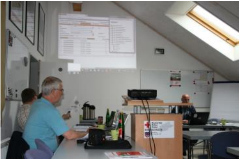
Ausbildungen des DRK Kreisverbandes in Bad Honnef