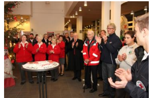
Ausstellungseröffnung im Rathaus