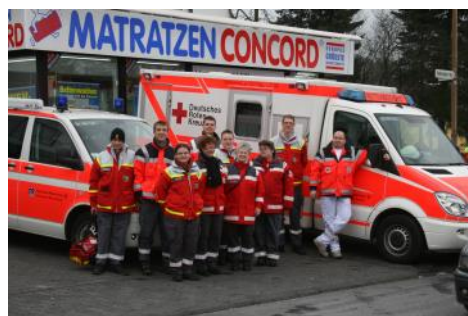
Bereitstellung Rettungs- und Sanitätsdienst