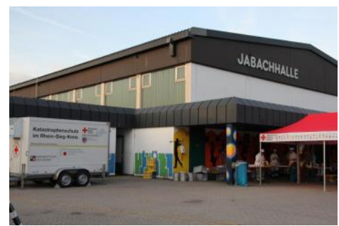
Unwetter Einsatz— von Bad Honnef bis Lohmar