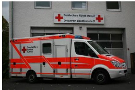
Rettungswagen 1 vor der Rettungswache