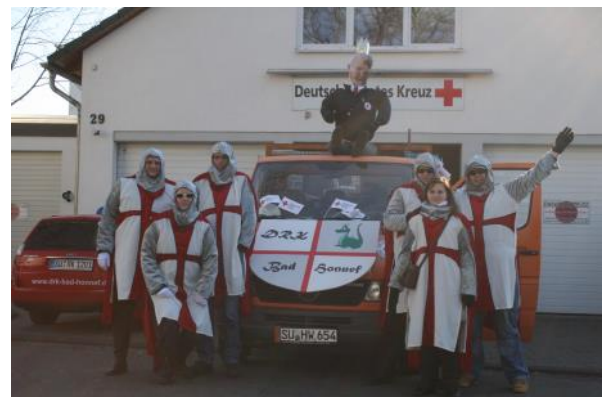
König Siegfried und ein Teil seiner treuen Ritter