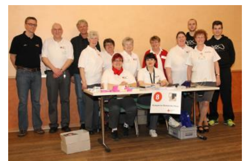
Dragons Rhöndorf und das Blutspendeteam