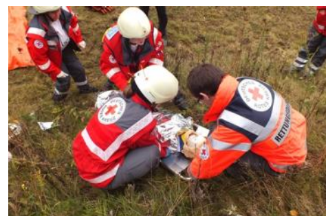
Übung, ein Teil der täglichen Aufgaben