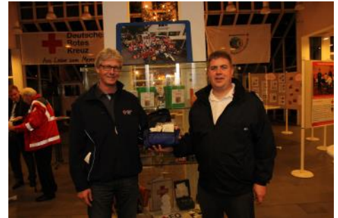
Ein starkes Team für den Ortsverein