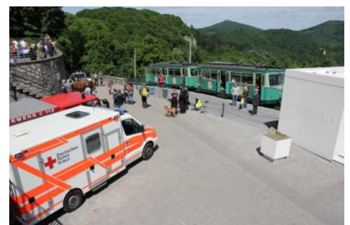
Bereitstellung „Eröffnung des Drachenfels“