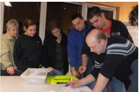
Helferfortbildung am Standort