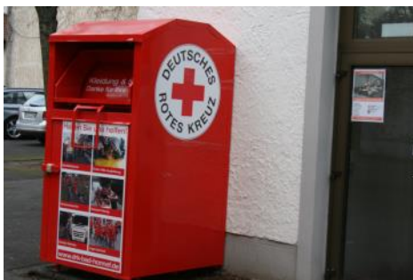
Neue Altkleidercontainer im Stadtgebiet