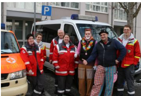
Bereitschaftsleitung zu Besuch—Rathaussturm