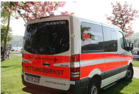
Neuer Krankenwagen im Fuhrpark des Ortsvereins