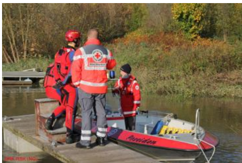
Tauchereinsatz im Toten Arm