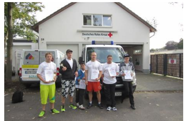
Teilnehmer des 1. Sommerbiathlon in Bad Honnef