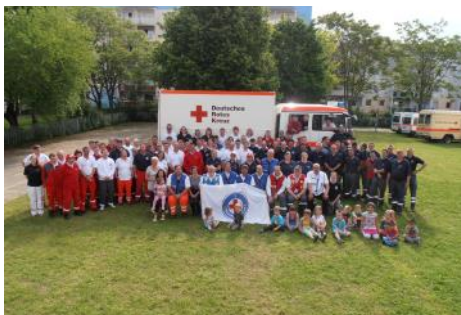
Wenn auch „nur“ im Hintergrund—Hochwasser 13