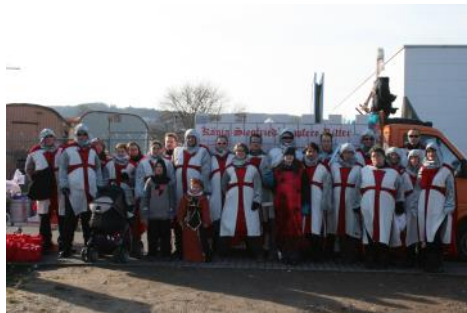
Karneval im DRK, dieses Jahr mal anders....