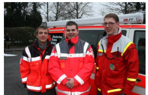
Zusammenspiel nicht nur an Karneval—DRK und JRK