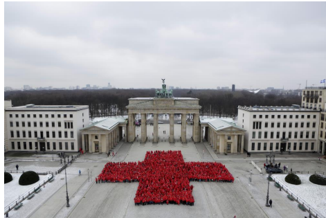
150 Jahre Rotes Kreuz—Ein Zentrales Thema 2013