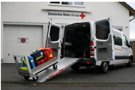
Fahrzeug der SEG Ärzte des DRK im Rhein-Sieg