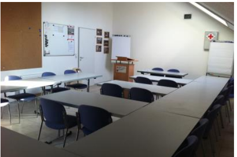
Der „neue“ Schulungsraum wird 2014 erweitert